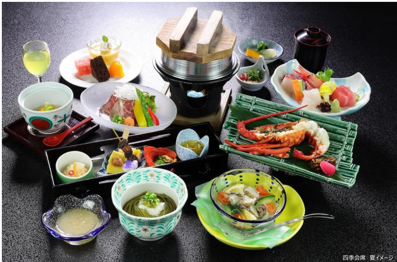
四季会席 夏イメージ

H.I.S.ホテルホールディングス株式会社（本社：東京都港区）が運営する、満天ノ 辻のやは、夏の新メニューとして、「四季会席 夏」、「夏のアフタヌーンティー」付きの宿泊プランを3月14日（金）より発売します。