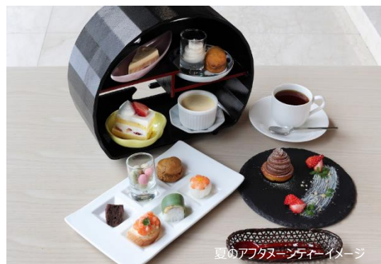
夏のアフタヌーンティーイメージ

石川県の名湯・粟津の温泉宿である、満天ノ 辻のやは、「令和6年度調理師関係功労者に対する厚生労働大臣表彰」において、「調理業務功労者」を受彰した、総料理長考案の夏の新メニューとして、「四季会席 夏」、「夏のアフタヌーンティー」をお楽しみいただける宿泊プランを3月14日（金）より発売します。「四季会席 夏」は、1日限定50食のご用意となり、食前酒に夏みかんカクテル、組肴に鱧の南蛮漬け、白身魚のお造り、一口そば、焼イセエビ、ローストビーフサラダ、鮑水貝、しらすの釜飯、デザートにガトーショコラなどをご提供します。「夏のアフタヌーンティー」は、ケーキやスコーン、プリンだけでなく、エビの手毬寿司やサーモンのカナッペなどをご提供します。夏季は敷地内にある、大型プール・お子様向けすべり台付きのプールもご利用いただけます。「四季会席 夏」の夕食、朝食の2食付39,800円～、「夏のアフタヌーンティー」と「四季会席 夏」の夕食、朝食の2食付44,800円～（いずれも4名様1室利用、お1人様1泊、税別）公式ホームページ： https://www.mantenno.com/